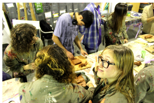
Becarios en acción dentro del taller

Luego de las adaptaciones y reajustes propias de todo comienzo -una beca de estudios implica un enorme compromiso que, a pesar de las ganas iniciales, no todos están en condiciones de cumplir- quedó conformado un maravilloso grupo de dieciséis jóvenes que recorrerán el Programa de Formación hasta mediados de 2014. El primer cuatrimestre tuvo como principal objetivo propiciar la integración entre ellos y brindarles las primeras herramientas técnicas y sobre todo de pensamiento para que puedan empezar a acercarse al arte contemporáneo.