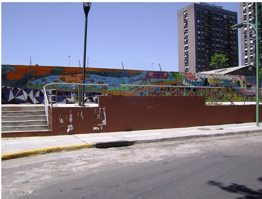
Mural realizado en el barrio de Catalinas Sur. La Boca "El agua, urgencias de la especie"