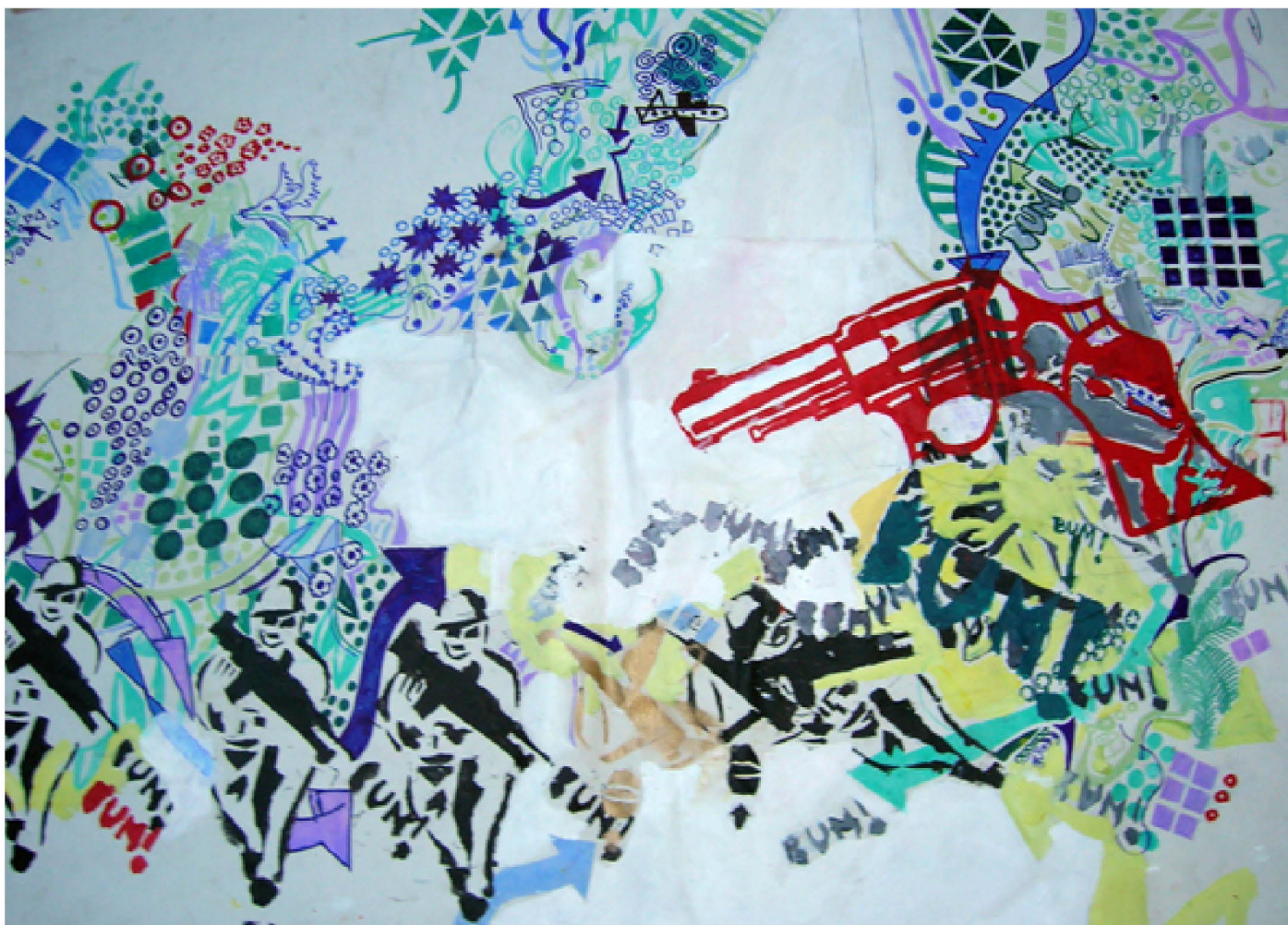
Obra de Mariano Benedetti

En el mes de Marzo de 2011, en la Universidad de Harvard, ProyectArte presentará una muestra de arte, junto con un panel de discusión: "Educación artística y empoderamiento social".