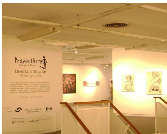
ProjectArte en el C. C. Borges

La muestra puede visitarse en forma libre o guiada por los mismos expositores hasta el 17 de octubre, de lunes a sábados de 10 a 21 hs y los domingos de 12 a 21 hs (+ info www.projectarte.org/blog ). Para combinar las visitas llamar al 4899-0444 o escribir a info@projectarte.org